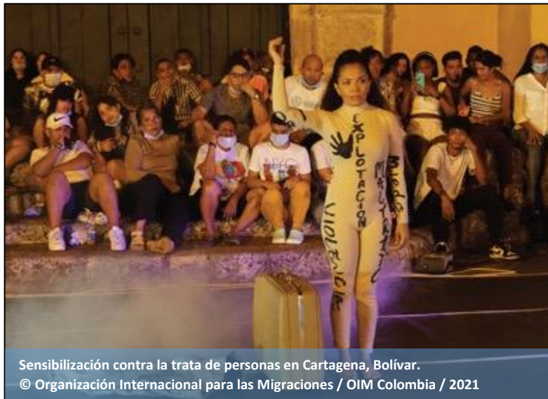
Sensibilización contra la trata de personas en Cartagena, Bolívar.

Por otro lado, OIM, en coordinación con el Ministerio del Interior y los Comités Nacional y Departamentales de Lucha contra la Trata de Personas, apoyó la descentralización de la política pública de trata de personas , a través de capacitaciones dirigidas a los miembros de los Comités Departamentales sobre el Decreto 1818 de 2020 Estrategia Nacional de Lucha contra la Trata de Personas (2020-2024) . Para esto se diseñó e implementó la metodología “Estrategias contra la Trata” la cual busca a través de la pedagogía, la difusión y apropiación en el nivel local de las políticas públicas contra la trata de personas en apoyo a la labor de coordinación del Ministerio del Interior. Esta apropiación fue posible gracias al acompañamiento en la