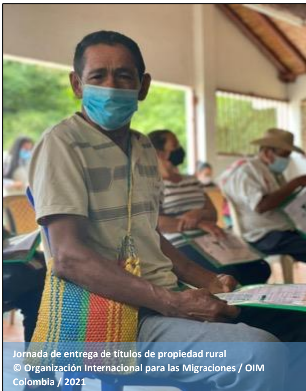
Jornada de entrega de títulos de propiedad rural

En cuanto al apoyo a proyectos productivos , fueron implementados alrededor de 130 proyectos productivos integrales que recibieron capacitación y fortalecimiento en comercialización, generación de ingresos, seguridad alimentaria, enfoque étnico, ambiental y empoderamiento de la mujer. Con la asistencia técnica brindada los beneficiarios mejoraron sus conocimientos y habilidades en empoderamiento, mercadeo, producción, finanzas, y gestión empresarial.