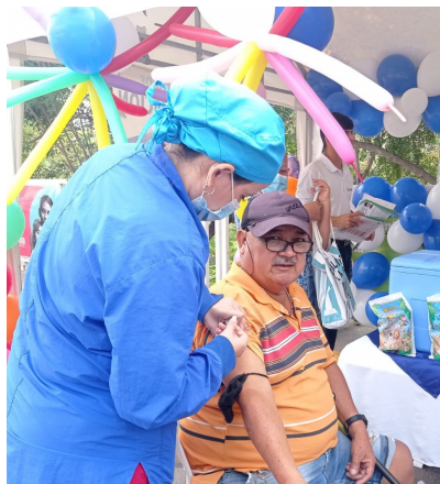
Jornada de vacunación 'Yo me cuido'. Puente Internacional Simón Bolívar. Cúcuta, Norte de Santander.

Con apoyo de las Redes Comunitarias de Salud, en los puntos de entrada de Guajira, Norte de Santander, Arauca, Puerto Carreño y Nariño, la OIM realizó acciones de IEC en el marco de las Iniciativas Saludables, acciones de movilización social, actividades de prevención del COVID-19, entrega de preservativos, activación de rutas en violencia basadas en género (VBG), desnutrición, salud materna y salud mental entre otros.