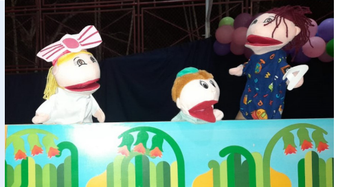
Iniciativa Saludable “Tarima viajera por la salud”, Inírida, Guainía. Agosto, © OIM 2022.

En Inírida , Guainía, con la Iniciativa Saludable ‘Tarima viajera por la salud’ la red ‘Unidos por un mejor mañana’ promovió la vacunación del COVID 19, a través de una puesta en escena que mostró los mitos y realidades sobre las vacunas.