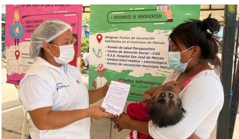
Réplica estrategia "Prevención al ritmo del son #AloBien" en el asentamiento La Pista, Maicao, La Guajira.

En este marco de las Iniciativas Saludables, los líderes y lideresas de las Redes Comunitarias de Salud de La Guajira, Vichada y Guainía realizaron acciones de Información, Educación y Comunicación (IEC) para prevenir en sus comunidades el COVID-19.