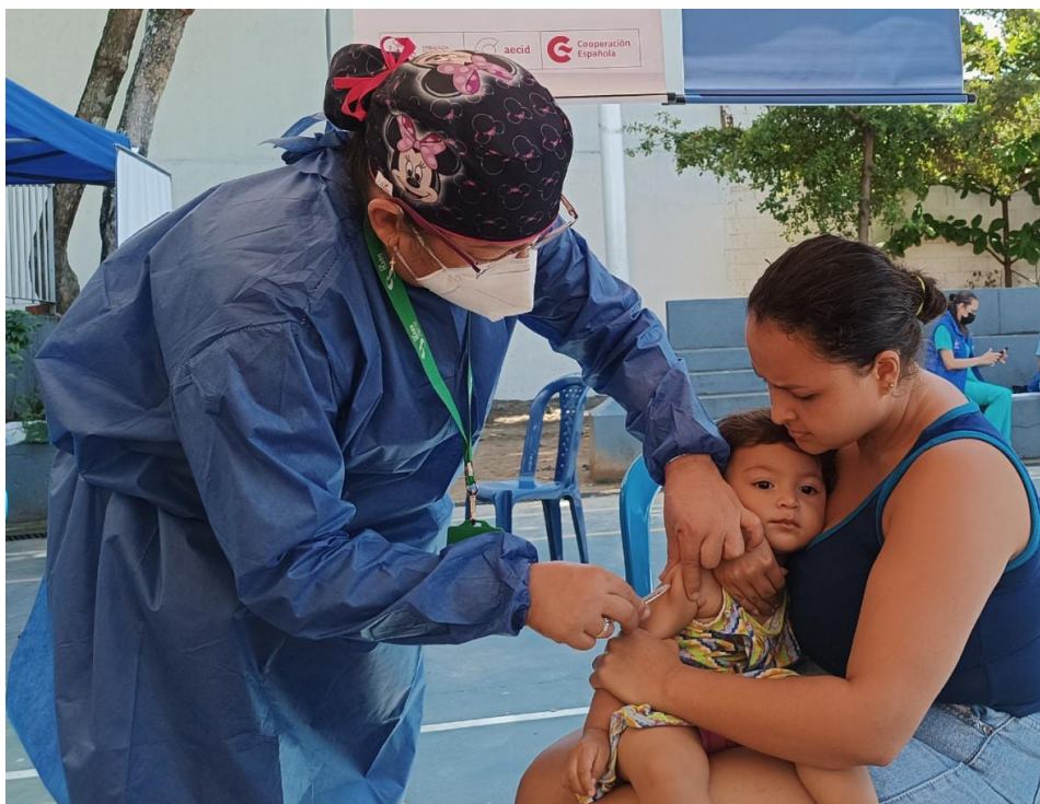
Jornada de vacunación. Cancha del barrio San Martín. Bucaramanga, Santander.

Desde el inicio de la pandemia se han elaborado nueve boletines para visibilizar las acciones implementadas gracias al apoyo financiero de la Oficina de Población, Refugiados y Migración del Departamento de Estado de los Estados Unidos (PRM) y de la Agencia Española de Cooperación Internacional para el Desarrollo en Colombia (AECID). Con el presente boletín se cierra este reporte de preparación y respuesta ante el COVID-19, presentando los resultados del año 2022.