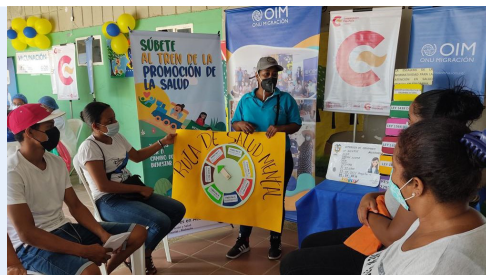
Réplica estrategia “Súbete al tren de la promoción de la salud”. Riohacha, La Guajira.

En Riohacha , La Guajira, la red comunitaria ‘Líderes en acción’ implementó la Iniciativa Saludable “Súbete al tren de la promoción de la salud”, mediante la cual difundieron en puntos estratégicos del municipio, mensajes clave para prevenir el COVID-19.