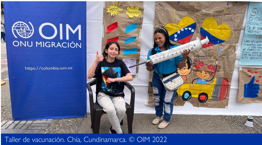
Taller de vacunación. Chía, Cundinamarca.

Personas atendidas por neurología, gracias al convenio con el Hospital Mental de Antioquia y al Hospital Mental Rudesindo Soto de Norte de Santander.