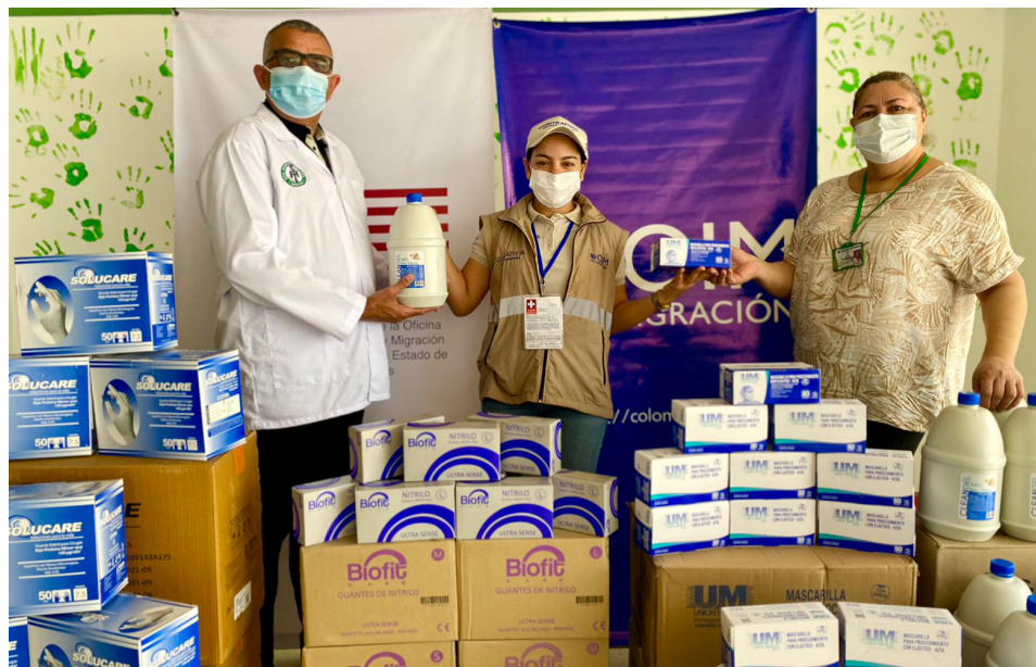
Donación de elementos de protección personal (EPP). Riohacha, La Guajira.

*Fe de erratas: Esta cifra se modificó respecto al boletín anterior. En la edición del primer semestre de 2022 se indicó que la cifra de elementos de protección personal era 263.704. Esta cifra fue errada, la correcta es 75.686.