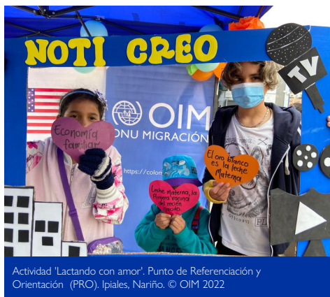
Actividad 'Lactando con amor'. Punto de Referenciación y Orientación (PRO). Ipiales, Nariño.

La Organización realiza estas acciones en coordinación con la IPS Municipal de Ipiales en los albergues Reina Isabela, Avenida las Lajas, Guayarillo, Alfonso López y Chilcos. En la ruta del caminante, con la Unidad Móvil de la IPS y en la Terminal de Transporte de Ipiales la OIM realiza atenciones en salud, que incluyeron vacunación y medicina general.