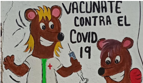
Jornada de vacunación contra el COVID-19. Puerto Carreño, Vichada.

En Puerto Carreño , Vichada, la red comunitaria ‘Sinergia: Vichada sin Fronteras’ implementó la iniciativa “Sembrando Vida” para sensibilizar a la población en los procesos de aseguramiento en salud y vacunación COVID-19. Esta acción se hizo con la difusión de una pieza radiofónica por medio del perifoneo en las principales calles del municipio y por emisoras locales.