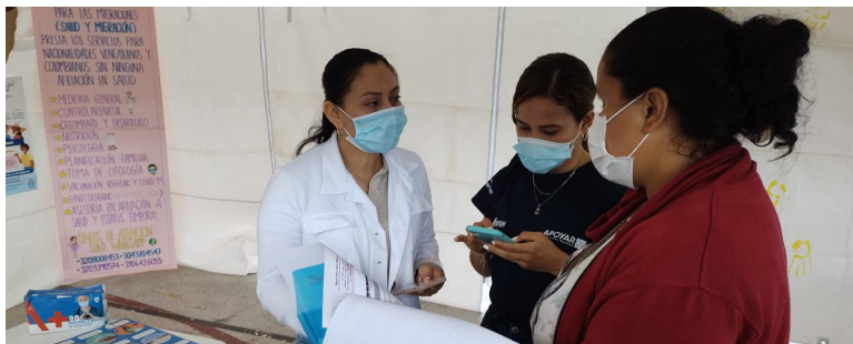
Acciones de Información, Educación y Comunicación para la prevención del COVID-19. Arauca, Arauca.

Con el objetivo de apoyar la implementación del Plan Nacional de Vacunación, la OIM fortaleció las capacidades del personal de salud de las secretarías de salud y de los hospitales aliados en los municipios de Arauca, Arauquita, Tame y Saravena del departamento de Arauca, mediante la donación de insumos de vacunación y equipos para el mantenimiento de la cadena de frío. Adicionalmente, se implementaron acciones de información, educación y comunicación, promoviendo en las comunidades el derecho a la vacunación y las rutas de acceso a servicios de salud. Estas acciones se realizaron gracias al apoyo financiero de la Agencia Española de Cooperación Internacional al Desarrollo – AECID.