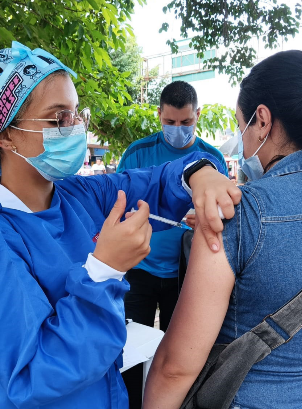
Acompañamiento a entidades sanitarias territoriales en jornada de vacunación. Puente Internacional Simón Bolívar, Villa del Rosario, Norte de Santander.